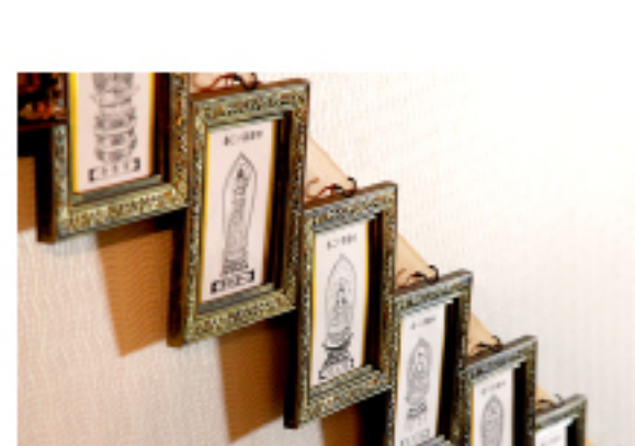
四国八十八ヶ所コーナーは宿泊者だけの お楽しみ!!とっておきコーナー